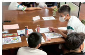
在著色繪畫的過程中得到放鬆、療癒