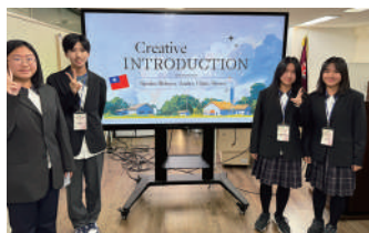
以英語致詞，介紹學校特色與家鄉文化