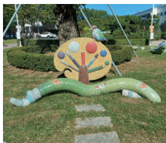
調色盤馬賽克鑲嵌作品

公共藝術不只是藝術作品，而是城市美學與社會教育的重要環節，它打破美術館的疆界，讓藝術走出象牙塔，在潛移默化中豐富大眾的精神生活，實現「藝術即生活，生活即藝術」的具體價值，將藝術融入日常生活，提升整體生活品質與美學素養。