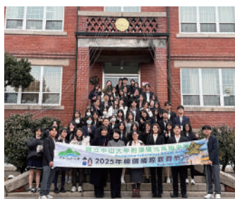
至培花女子高等學校進行全天候交流