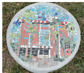
國光館馬賽克鑲嵌作品