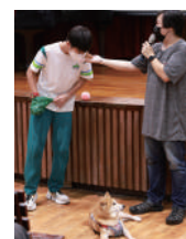
學習如何清理狗狗 的排泄物，維持 環境清潔