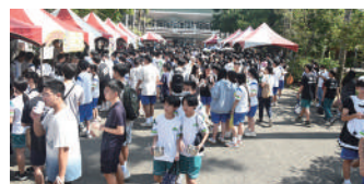
學生攜帶環保餐具選購攤位食物 及飲品