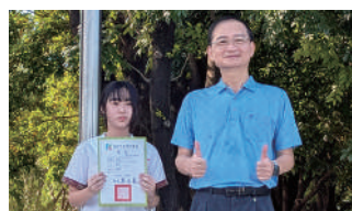
114年度語文競賽初賽-國語演說第一名