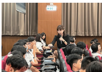
參訪國立中興大學