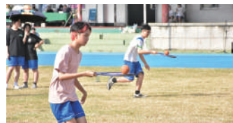
各班選手發揮團隊精神，爭取最高榮譽