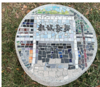
忠孝館馬賽克鑲嵌作品