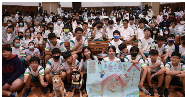
國二4班同學精心製作歡迎海報送給小米講師