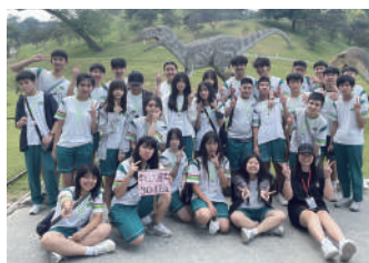
九九峰動物樂園新奇又有趣!