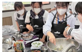
日方學生指導附中學生製作日本美味小吃章魚燒