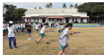
國一組首先出發，選手們使出渾身解數往前衝刺