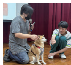
實際演練如何與 陌生狗狗互動