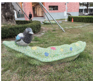
豆莢、喜鵲馬賽克鑲嵌作品