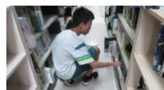
國二參賽學生於中文書區查找圖書