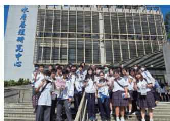
參觀國立嘉義大學水產養殖中心

最後一天來到六福村主題樂園，遊樂設施包羅萬象，既體驗遊憩樂趣，也增進對野生動物生態的認識，為三天充實又難忘的活動畫下完美的句點。