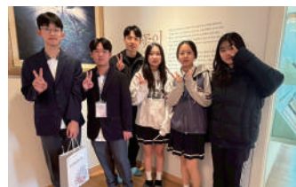
學生互動融洽開心合影