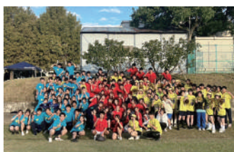
本校學生參加奈良女子大學附中運動會後與日方學生合影