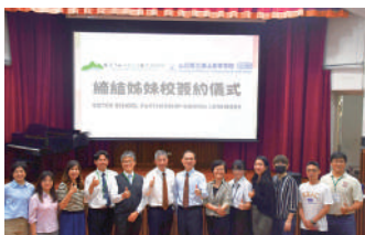
簽約儀式後兩校師長合照共同見證這歷史性的一刻