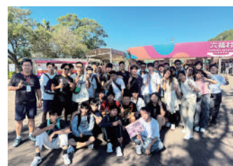
暢遊六福村主題樂園