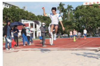
高二男跳遠競賽，選手奮力跳躍