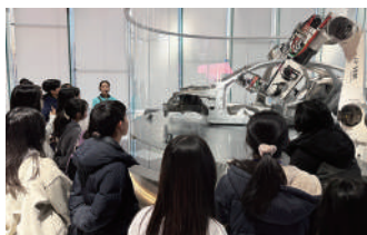
參訪現代汽車體驗館