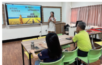
麥茶老師穿著拉丁美洲的傳統服飾進行演講，並帶來許多當地風格小物贈送參與的師長