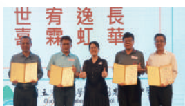
頒發榮譽會長聘書