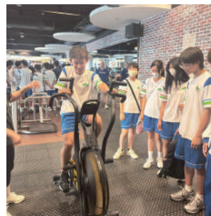
學生體驗不同器材設備的 運動效果