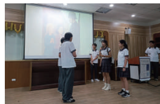
雙語實驗班學生以全英戲劇方式 呈現「讀出素養力」課程中所閱讀 之小說內容