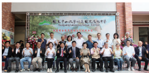
參與典禮貴賓一同合影留念