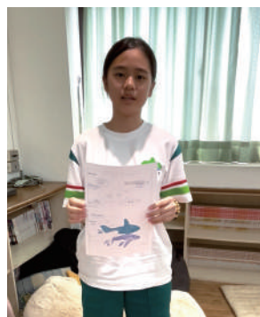
國一4班學生分享「與鯨豚共游」，讓她對鯨豚有更多認識