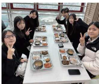
與韓國學生一同享用營養午餐