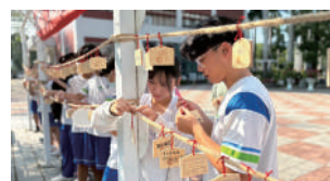
學生專注的將寫有心願的繪馬綁在祈福區