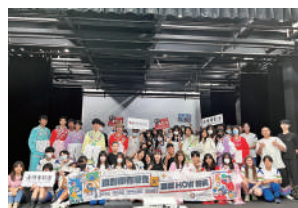
高一學生著戲服與豫劇團演員 和工作人員合影