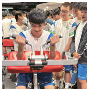
參訪柏文健康事業股份有限公司 旗下健身工廠

自我認識與環境探索是同學們生涯選擇的重要環節，學校將持續與政府、家長及企業單位合作，提供多元探索機會，努力拉近學生與職場的距離，期盼中山附中的每位學子都能找到讓自己發光發熱的所在。