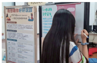
學生在展覽中收獲非暴力溝通 技巧及心理健康自學資源

輔導室期望透過此次活動，讓同學理解：照顧心，就像照顧身體一樣重要。願每一位同學都能成為自己的避風港，也成為他人的一盞微光。