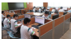
國一參賽學生利用電腦查找圖書的索書號