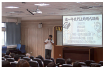
雙語實驗班學生分享週六課輔 (地理VR、系統思考、國文寫作、 Canvas英文簡報教學等)課程內容