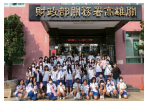
本校師生於財政部 關務署高雄關前合影