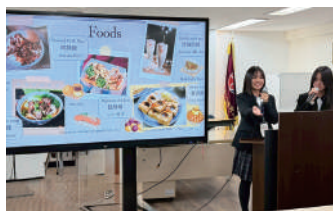
以食會友，教導韓國師生中文詞彙