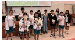
有獎徵答活動提供文具禮品，鼓勵上台答題的學生。