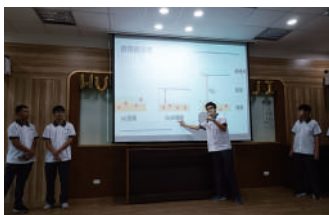
數理實驗班學生分享課程「科學新知」所學關於半導體的奧秘