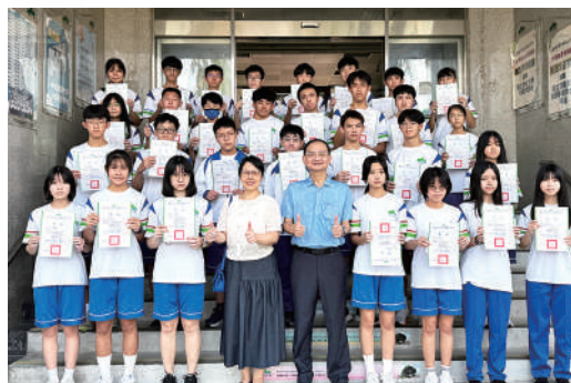
114學年度績優入學頒獎