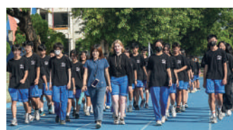
國一及高一各班精心準備隊呼進場，歡慶學校生日快樂！