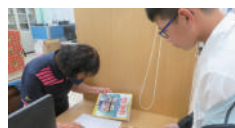
國一參賽學生將找到的圖書拿至櫃檯確認蓋章