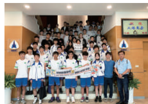
本校師生與漢翔航空工業 公司導覽人員合影