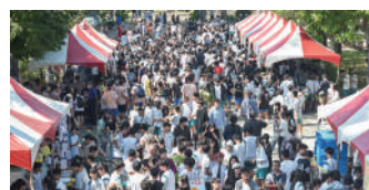
園遊會當天攤位區各式美食與飲料銷售熱絡，學生及家長熱情參與盛況

歷經事前的集思廣益及腦力激盪，各班皆構想出一套獨有的預購及現場販賣方式。園遊會當天現場人山人海，攤位區各式美食與飲料銷售熱絡，更隨處可見師生及親友一同響應自備餐具，到校參與的家長及來賓皆讚賞這是一項很棒的活動。經過近幾年持續宣導，學生自備餐具的比例顯著提升，租借需求大幅下降，現在多數學生能主動攜帶環保杯、碗、筷，校內垃圾量也明顯減少，顯示減塑觀念已在學生心中逐漸內化。