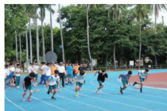
國二男100公尺競賽選手在起跑槍聲響起後衝出起跑線