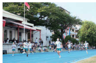
國一組大隊接力，各棒次選手卯足全力衝刺