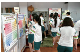
學生於下課時間至團輔室參觀展覽