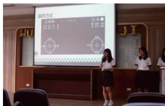
數理實驗班學生分享課程 「無人機的奇幻之旅」課程內容

此次成果發表會提供高二實驗班學生展現學習成果的舞台，不僅幫助高一新生了解課程內容，透過觀摩學長姐的分享，更能熟悉實驗班的學習方向，幫助新生未來的課程規劃。