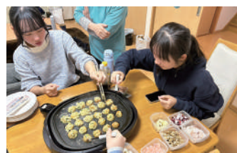
日本學生(左一)指導本校學生(右一)製作章魚燒