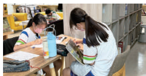
課外閱讀社高中部學生擷取文章重點，繪製心智圖