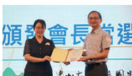
頒發新任林盈利會長當選證書