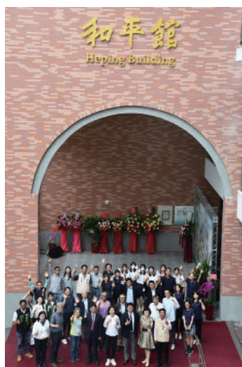
參加典禮貴賓與新建落成和平館合影

新綜合教學大樓為原「和平館」拆除重建，為延續校友記憶仍沿用原館名，並由教育部長鄭英耀題字。本校自民國108年提出興建需求，109年獲教育部補助2億320萬元。工程歷經物價上漲與流標等挑戰，後再申請國教署增補經費，總工程費達2億4,734萬3,000元，最終於112年動工，歷時兩年多順利完工。新大樓共有6層，設置24間普通教室、2間專科教室、2間多用途教室及3間教師辦公室，外觀採紅磚與斜屋頂設計，融入校園既有景觀，入口挑高圓拱營造學院氛圍。新和平館改善原有教室不足問題，未來可開設更多元課程，支持學生探索興趣與職涯方向，將成為本校推動雙語教育、數位學習與人才培育的重要基地。