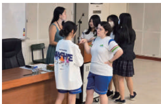
講師風格受到學生喜愛，本校巴西交換學生(右三)特別上台與講師交流