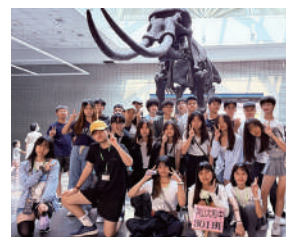
自然科學博物館開拓視野