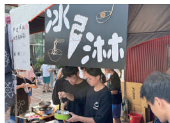
園遊會美食以環保餐具盛裝販售