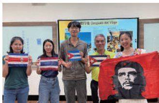
麥茶老師與參與師長持拉丁美洲不同國家的國旗合照