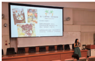
約克形容她在巴西的旅途，是一場「最人類學精神的旅程」

自主學習講座讓大家學會以開放心態擁抱不同文化，也激勵大家踏出舒適圈、勇敢追尋自己的夢想，培養國際視野與面對未來的勇氣。