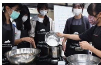
日本學生(右一)製作珍珠原料

此外，兩校學生也分別以英語簡報向對方師生介紹自己的學校與文化，日方學生帶來音樂與歌唱表演，展現青春活力與藝術才華；附中學生則介紹旗津的自然風貌與人文特色，讓日方師生對高雄留下深刻印象。透過與日本奈良女子大學附中的深度交流，兩校學生不僅學習語言，更以生活為橋樑，建立友誼、理解文化，這是最珍貴的學習經驗。