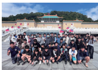
參觀國立故宮博物院