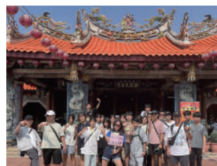
鹿港老街文化踏查