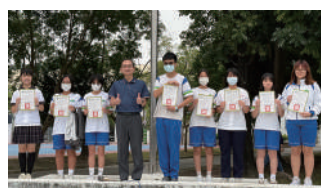
114年度語文競賽市賽獲獎頒獎