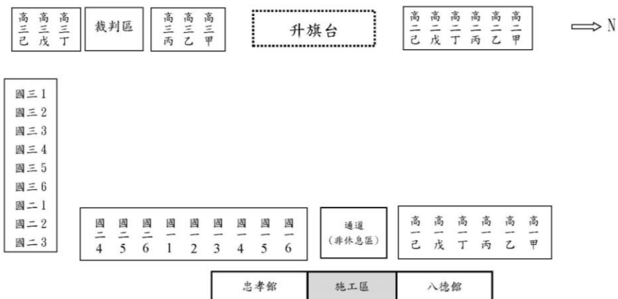
國立中山大學附屬國光高中 66週年校慶運動會各班休息區位置圖